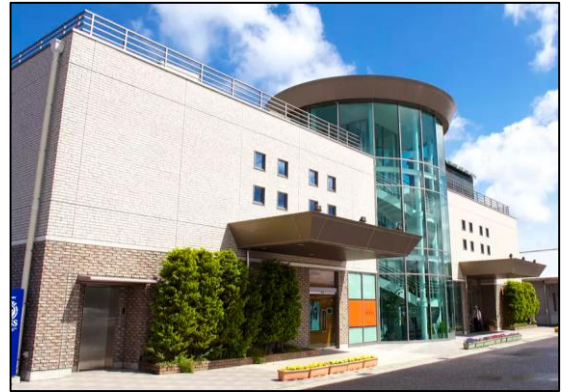
津なぎさまち ベイシスカ津 2階ルームABC